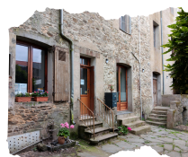
Clémence MORINIÈRE Surveillante de nuit