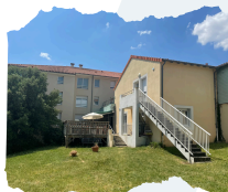
Émeline BURGAUD AMP