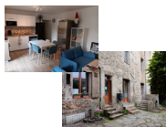
Habitats et SAVS "Les Villotiers" Beaupréau