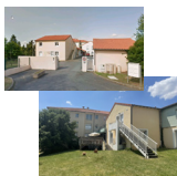
Résidence et UPHV "La Haie Vive" Cholet