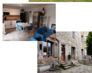
Habitats et SAVS "Les Villotiers" Beaupréau