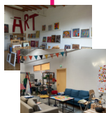
ESAT, SAESAT et Artothèque 9 Rue de Tours Cholet